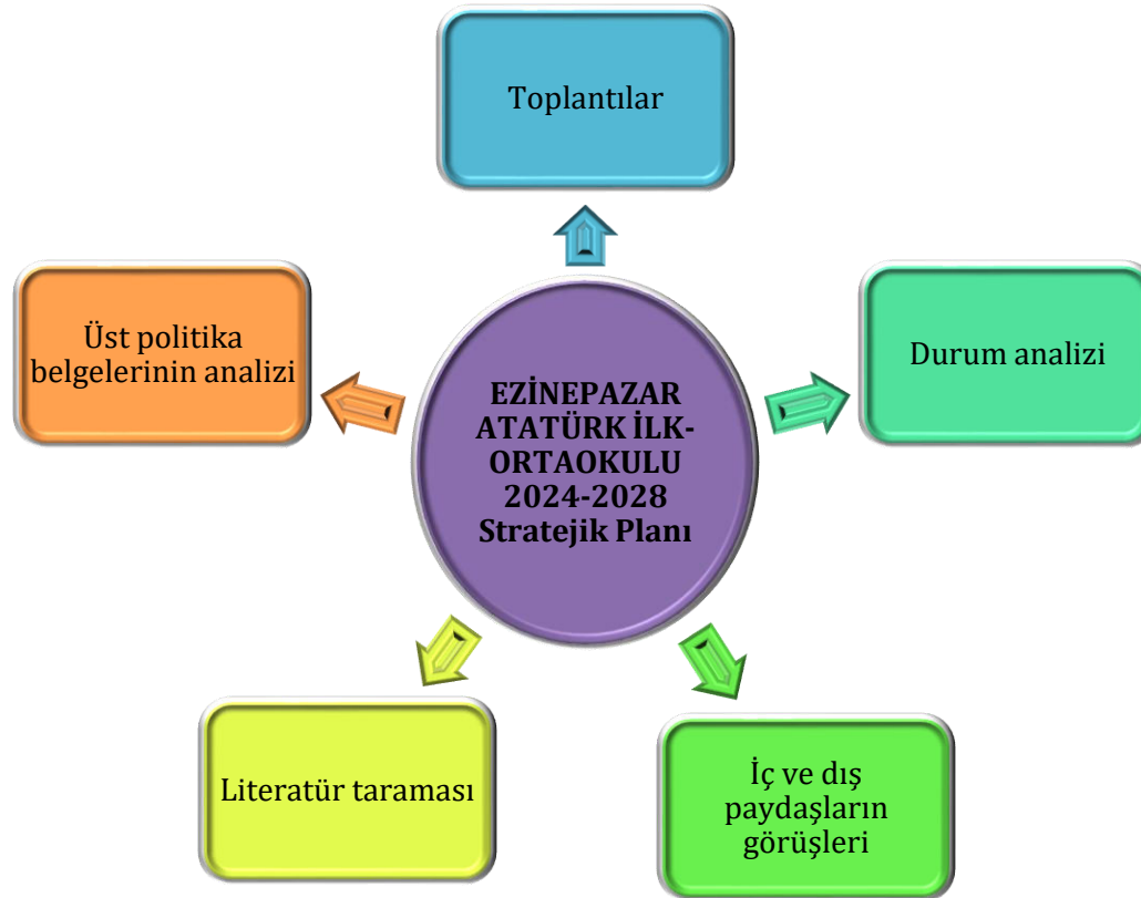
Şekil 1: Stratejik Plan Oluşum Şeması

Müdürlüğümüzün 2024-2028 stratejik planın hazırlanmasında tüm tarafların görüş ve önerileri ile eğitim önceliklerinin plana yansıtılabilmesi için geniş katılım sağlayacak bir model benimsenmiştir. Bu amaca ulaşabilmek için farklı fikirlerin plan metninde yer almasına ve değerlendirilmesine özen gösterilmeye çalışılmıştır. Stratejik plan temel yapısı Müdürlüğümüz Stratejik Planlama Üst Kurulu tarafından kabul edilen Müdürlük Vizyonu ulaşabilmek amacıyla eğitimin üç temel bölümü (erişim, kalite, kapasite) ile paydaşların görüş ve önerilerini temel alır nitelikte oluşturulmuştur.